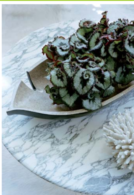
PAZDZIERNIK BEGONIA REX. KRÓLOWA W STYLU RETRO

Begonia królewska jest bardzo popularna. Występuje w tysiącach gatunków, form i odmian. Jej aksamitne liście, pokryte niezwykłymi wzorami, nadają begonii oryginalności. Dobrze nadaje się do spokojnych wnętrz z naturalnymi elementami (np. marmur, drewno). Idealny dla wszystkich osób ceniących harmonię, spokój i niewymuszoną elegancję.