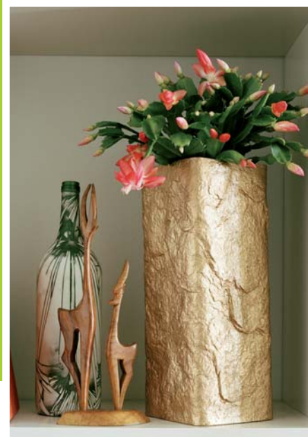
GRUDZIEŃ SCHLUMBERGERA. FLOWER POWER

Aksamit peten plamek i wzorów. Miltonia jest okazałym storczykiem z zielonymi liśćmi i pięknymi kwiatami, przypominającymi karnawał w krajach południowych. W Południowej Ameryce rośnie na gałęziach i pniach drzew. Miltonia jest dobrym pomysłem na prezent dla kogoś, kto lubi egzotyczne podróże i często przywozi z nich nietypowe pamiątki. Udekorowane nią mieszkanie będzie przywoływać miłe wspomnienia. Miltonię należy podlewać obficie, lecz dopiero wtedy, gdy podłoże zaczyna lekko przesychać. Storczyk ten wymaga również ciepłego i wilgotnego powietrza. Najlepszy jest półcień. Roślina dobrze czuje się na parapecie północnego okna.