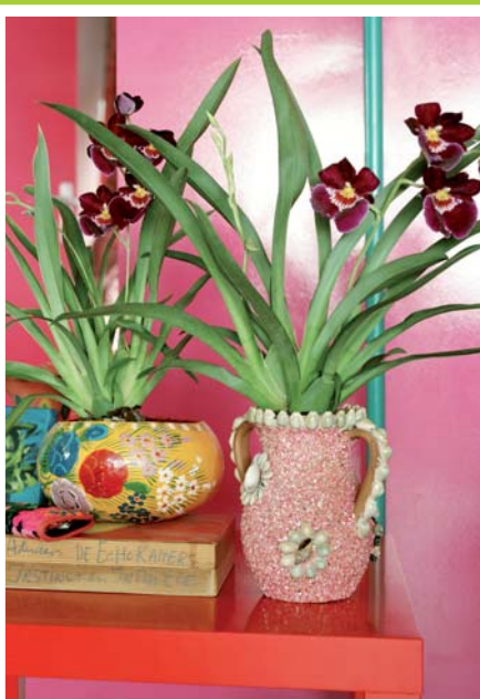
LISTOPAD MILTONIA. BAL MASKOWY

Wymaga stanowisk jasnych, osłoniętych przed bezpośrednim nasłonecznieniem. Należy podlewać ją miękką wodą oraz nie należy jej zraszać. Zaleca się umiarkowane nawożenie rośliny w dwutygodniowych odstępach.